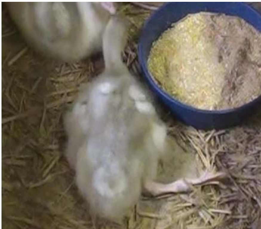
図 2. 脚弱の状況 (対照区)